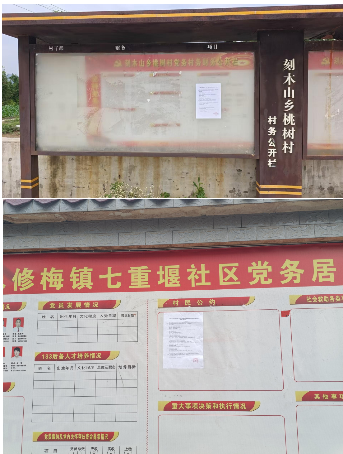
图 3.2-2 现场张贴照片