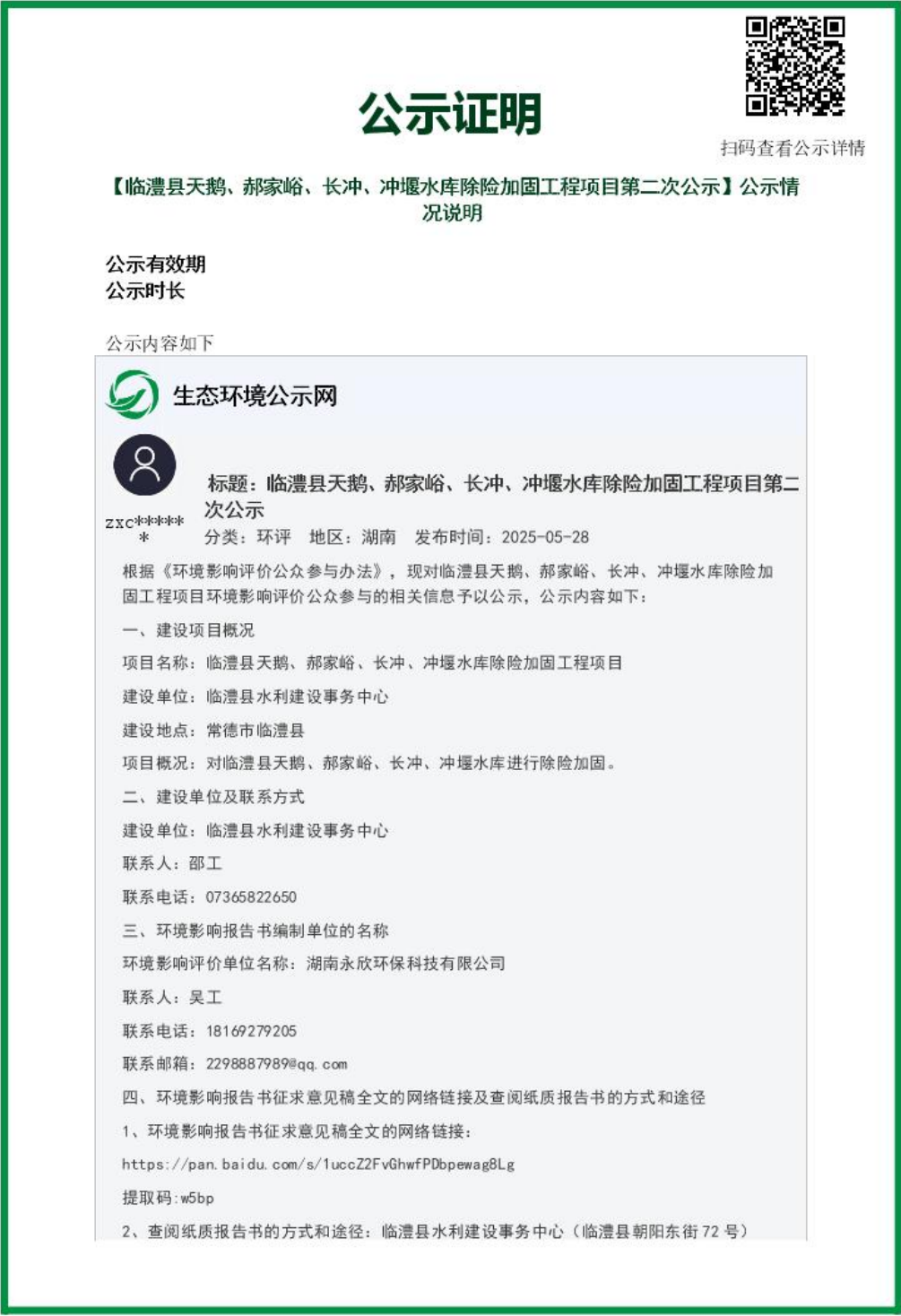
图 3.2-1 第二次环境影响评价信息公开网络公示截图