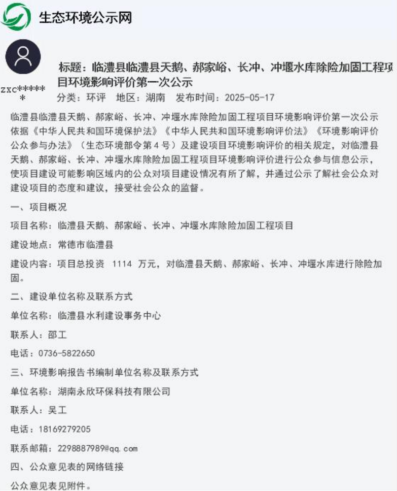
图 2-1 第一次网上公示