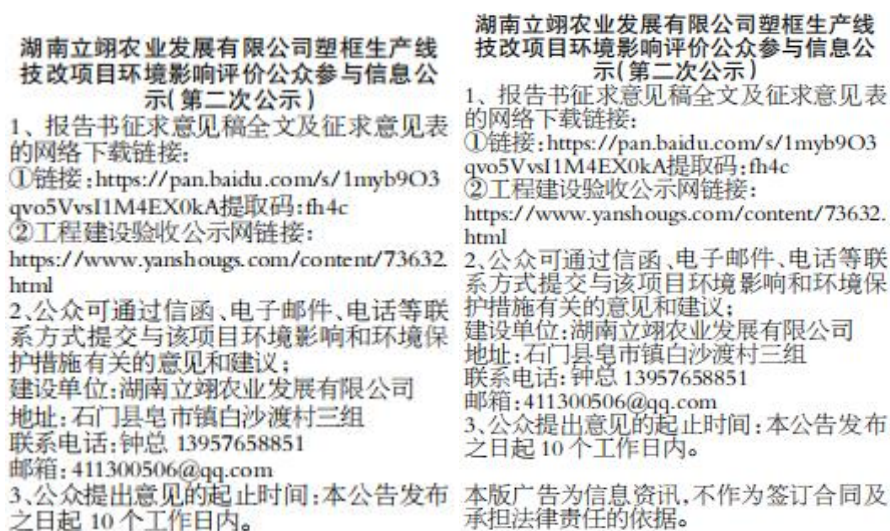
图 3 征求意见稿报纸公示照片