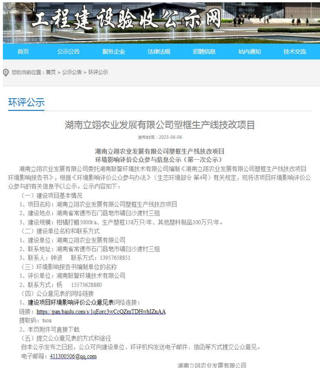
图 1 首次环境影响评价信息网络公示页面截图