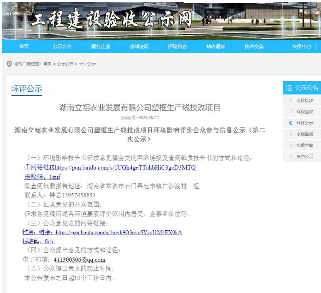
图 2 征求意见稿网络公示页面截图