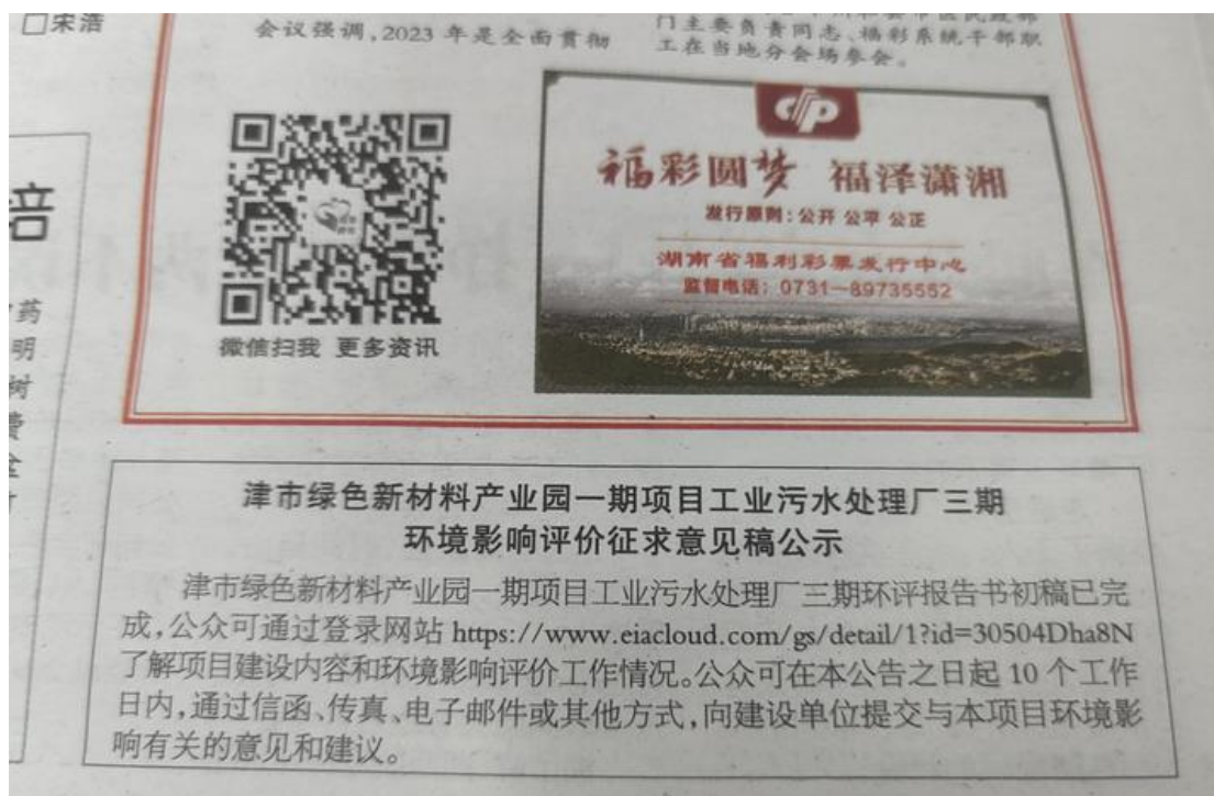
图 3.2-3 第二次报纸公示