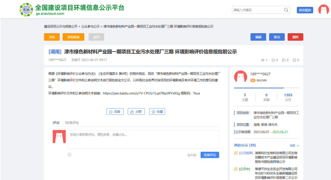
图 6.2-1 报批前报告全本和公参说明网络公示截图

2023 年 6 月 7 日，建设单位在全国建设项目环境信息公示平台上对津市绿色新材料产业园一期项目工业污水处理厂三期环境影响报告书及公参说明进行了报批前全本公示（ https://www.eiacloud.com/gs/detail/3?id=30607LIFhx ）。