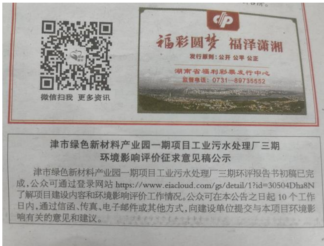
图 3.2-2 第一次报纸公示