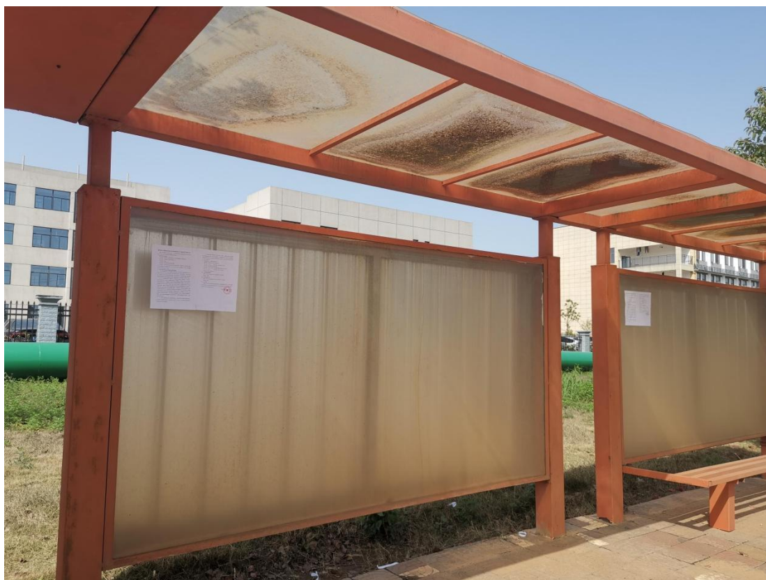
图 5 现场张贴公示