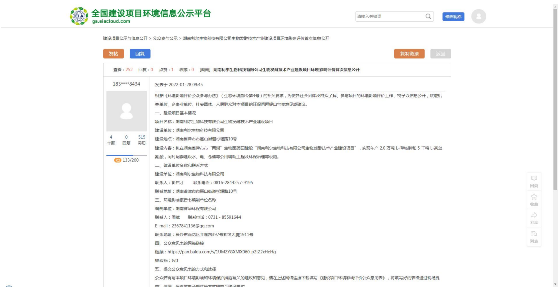
图 1 首次网络公示截图

公示网站为环评互联网，在环境影响报告书征求意见稿编制过程中，公众均可向建设单位提出与环境影响评价相关的意见，网址为： https://www.eiacloud.com/ 。公示截图见图 1。