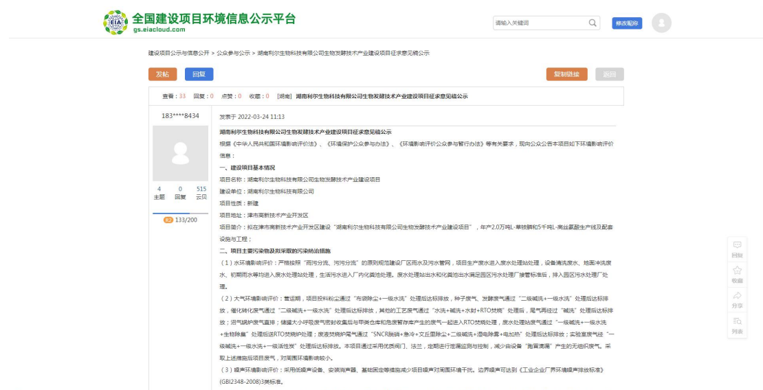
图 2 网络公示截图